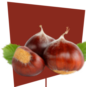
CASTAGNA CHESTNUT CASTAÑA KASTANIEN

OTHER PRODUCTS OTROS PRODUCTOS ANDERE PRODUKTE