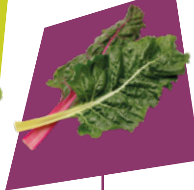
BIETOLA CHARD REMOLACHA CHARD