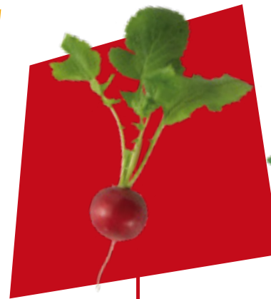
RAVANELLO RADISH RÁBANO RADIESCHEN