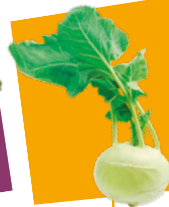
CAVOLO RAPA KOHLRABI COLINABO KOHRLARABI