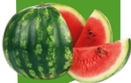
ANGURIA WATERMELON SANDÍA WASSERMELONE

ORGANIC PRODUCTS PRODUCTOS ORGÁNICOS ORGANISCHE PRODUKTE