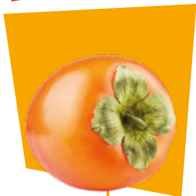
KAKI PERSIMMON CAQUI KAKI