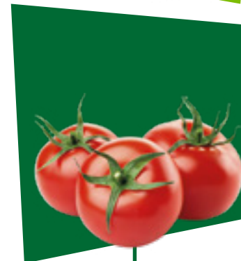
POMODORI TOMATO TOMATE TOMATE