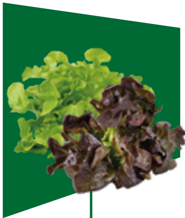
INSALATA LETTUCE LECHUGA SALAT