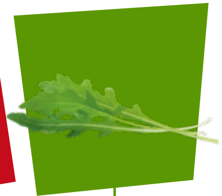
RUCOLA ROCKET RÚCULA RUCOLA