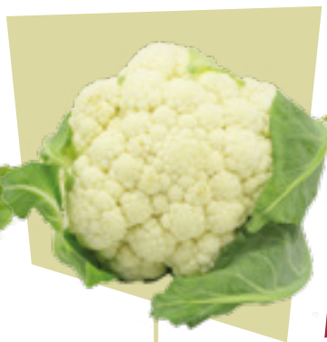
CAVOLFIORE CAULIFLOWER COLIFLOR BLUMENKOHL