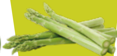
ASPARAGI ASPARAGUS ESPÁRRAGO SPARGEL