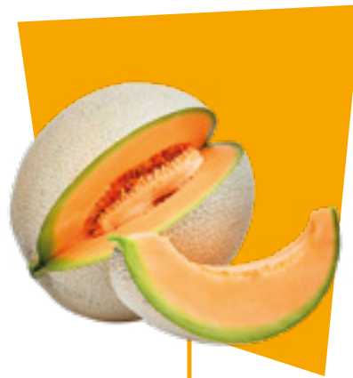
MELONE MELON MELÓN MELON