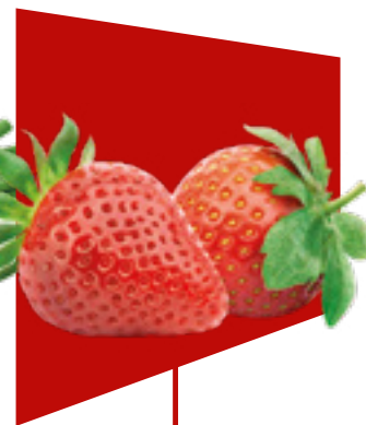
FRAGOLA STRAWBERRY FRESA ERDBEER