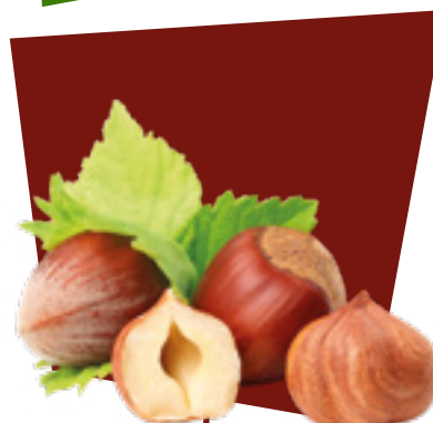
NOCCIOLA HAZELNUTS AVELLANA NUSS