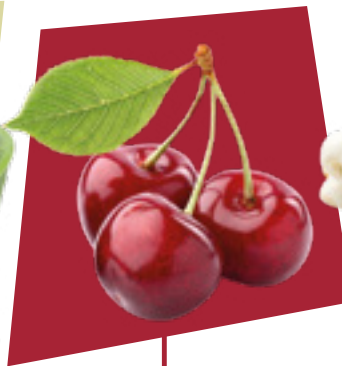
CILIEGIE CHERRIES CEREZA KIRSCH