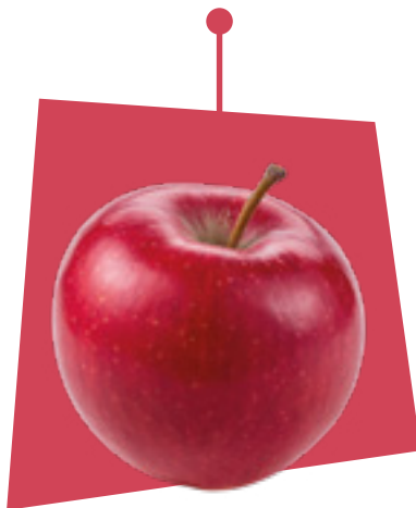
MELA APPLES MANZANA ÄPFEL